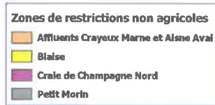
Zones de restrictions non agricoles (A.P. Cadre 2022)